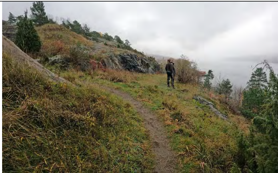
Kanonstilling utsikt mot syd 1/11-2020