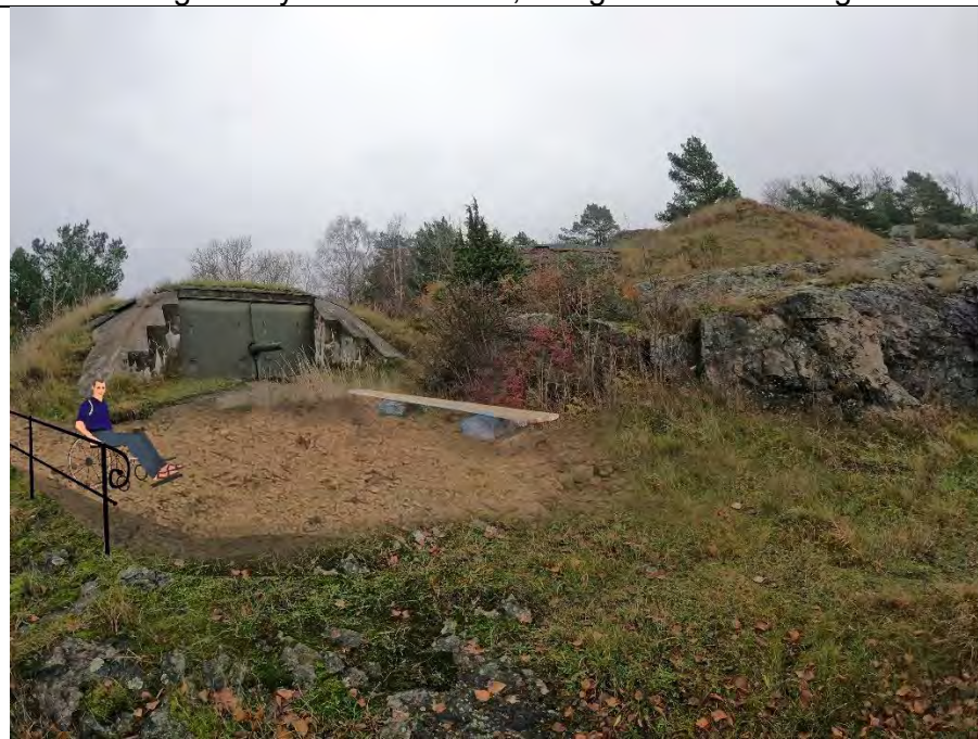
Kanonstilling mot nord med rekkverk, sti og sittebenk i eik og stein