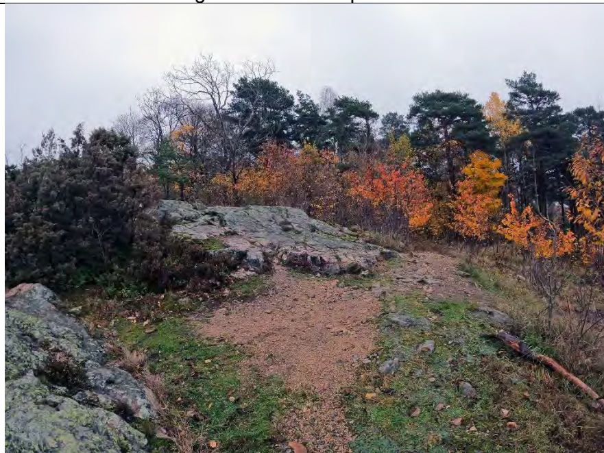
Rettt nord av kommandobunker nåtid 1/11-2020