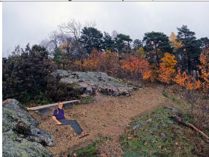
Liten plattform for rullestol pluss sittebenk i heltre eik og stein