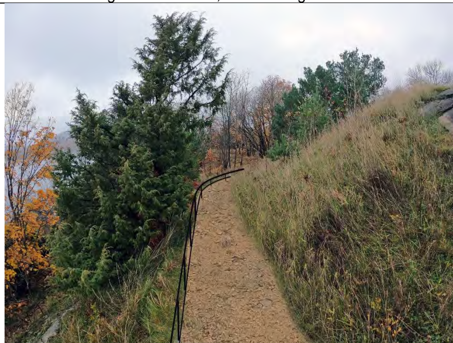
Fra kanonstilling utgang mot nord 1,4 – 2 m sti og rekkverk