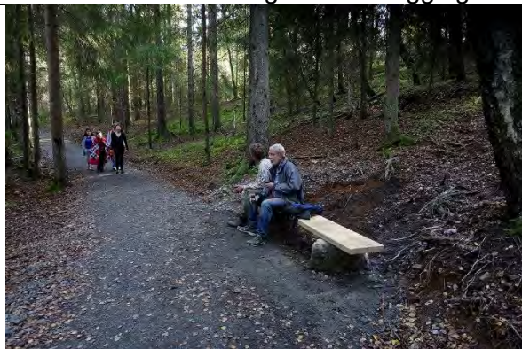
Plassering avstikker #2.