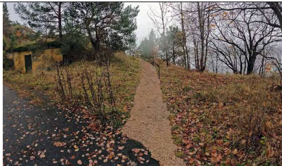
Mot kanonstilling fra nord med 1,4 – 2m sti og rekkverk