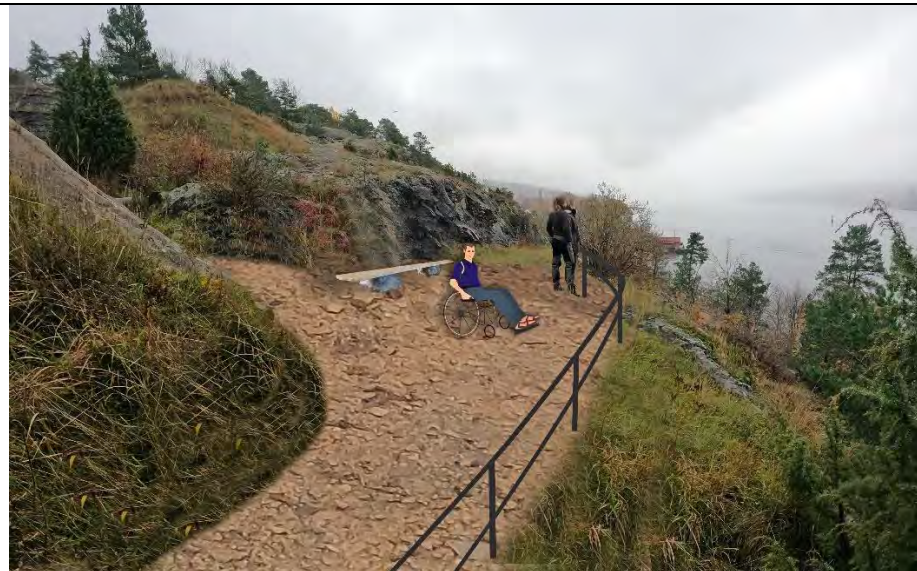
Kanonstilling mot syd med rekkverk, sti og sittebenk i eik og stein