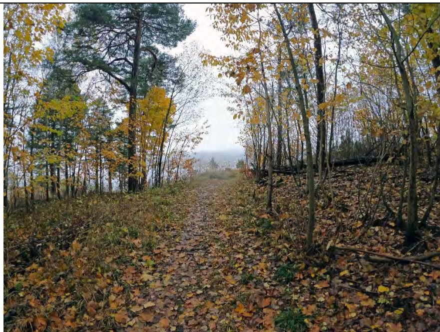
Fra offiserskaserna og mot kommandoplassen 1/11-2020