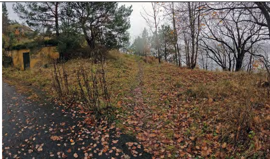
Mot kanonstilling inngang fra nord 1/11-2020