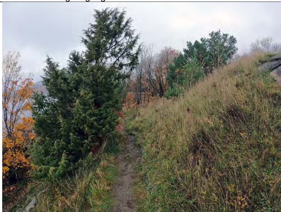
Fra kanonstilling utgang mot nord 1/11-2020