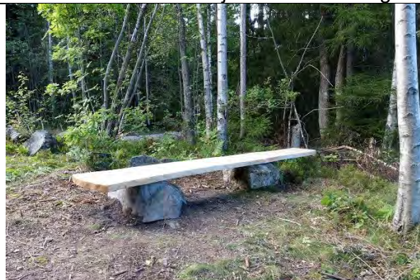
Plassering avstikker #1.

Robust benk med kjerneved av eik og stein-fundament. Krever ingen tilrettelegging