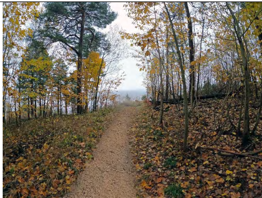
Fra offiserskaserna og mot kommandoplassen 1,4 – 2 m sti