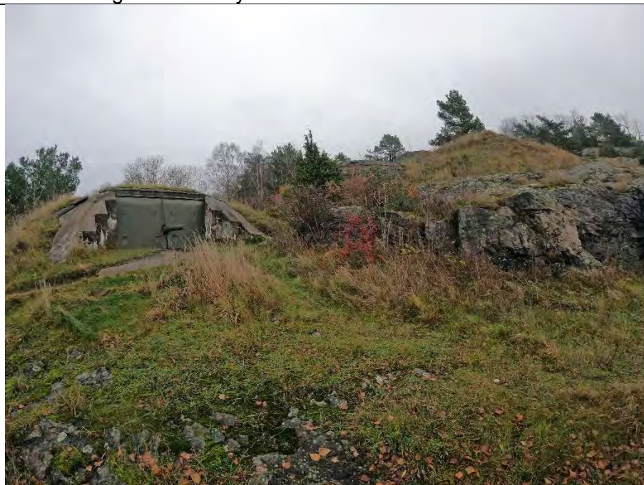
Kanonstilling mot nord 1/11-2020